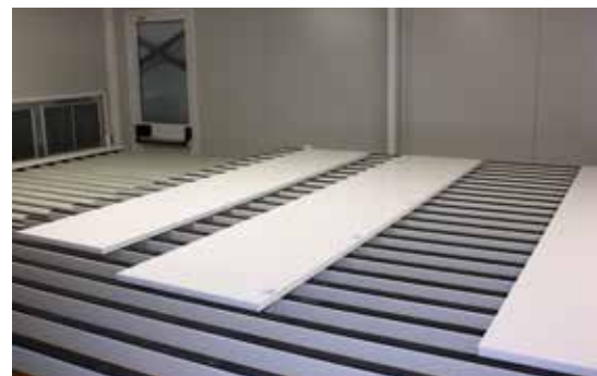
De gelakte panelen glijden door de stofvrije droogtunnel.

"We zorgen voor het vervoer in heel België. Doordat we het transport in eigen beheer uitvoeren kunnen we ook op dit vlak zeer flexibel op de vraag van onze klanten inspelen. Daardoor kunnen we altijd de beloofde levertermijn halen en dikwijls zelfs sneller werken. Dit lijkt voor buitenstaanders misschien vanzelfsprekend, maar we merken toch dat we hiermee in onze sector een uitzonderlijke plaats innemen." ■