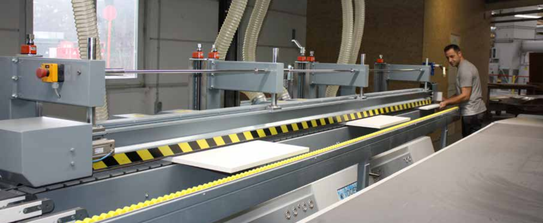
Het vakkundig bewerken van het lakwerk met de kopse kanten schuur- en poliermachine met retoursysteem.

"Vier jaar geleden investeerden we reeds in een volautomatische polierstraat. Daarbij hebben we ook de eerste stappen richting automatisering gezet. Het grote voordeel van de nieuwe lakstraat is dat we altijd onze levertermijn kunnen garanderen en de vraag naar grotere volumes competitief kunnen beantwoorden. Met de vroegere manuele aanpak was dit absoluut ondenkbaar. Nu kunnen en doen we dit wel en bovendien tegen zeer aantrekkelijke prijzen."